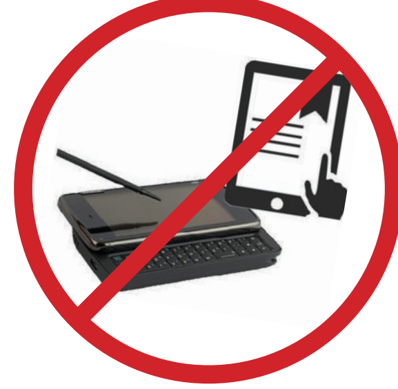
Cep bilgisayarı, bilgisayar özellikli bulunan cihazlar