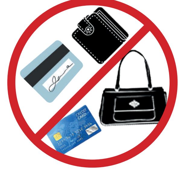
Çanta, cüzdan, kredi kartı, her türlü manyetik kart