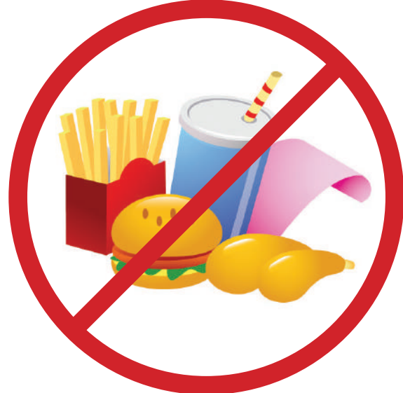
Yiyecek, içecek, gıda vb.