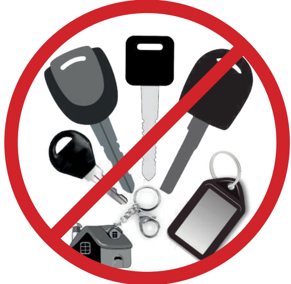
Basit olmayan her türlü ev anahtarı, araç anahtarı, anahtarlık ve plastik içerikli eşya