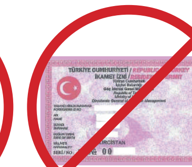
İkamet İzni Kartı