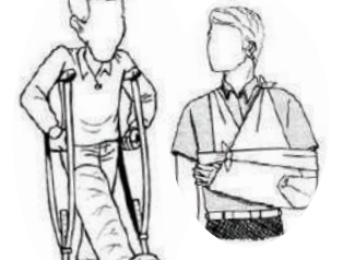
Alçı, koltuk değneği (sadece adaylar)