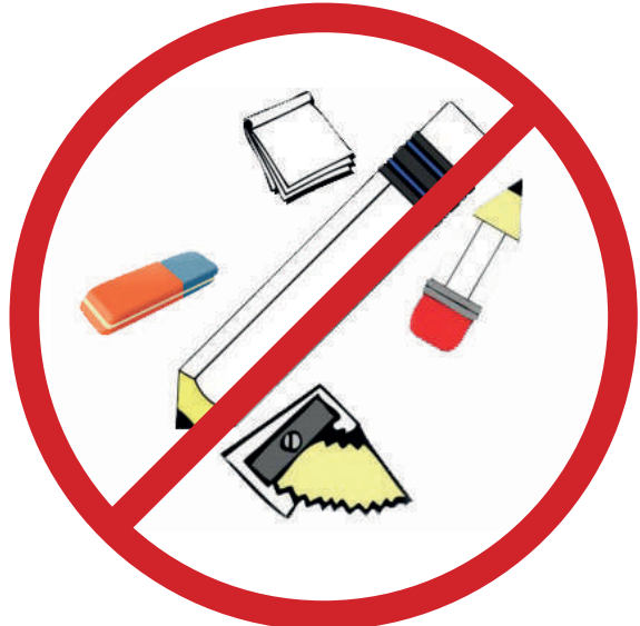
Kalem, silgi, kalemtraş