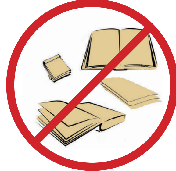
Müsvedde kâğıt, defter, kitap, sözlük