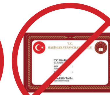
Yargı Mensubu Kimlik Kartı