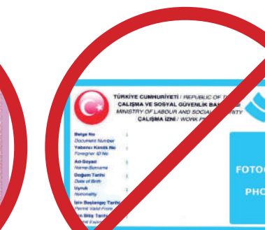
Çalışma İzni Kartı