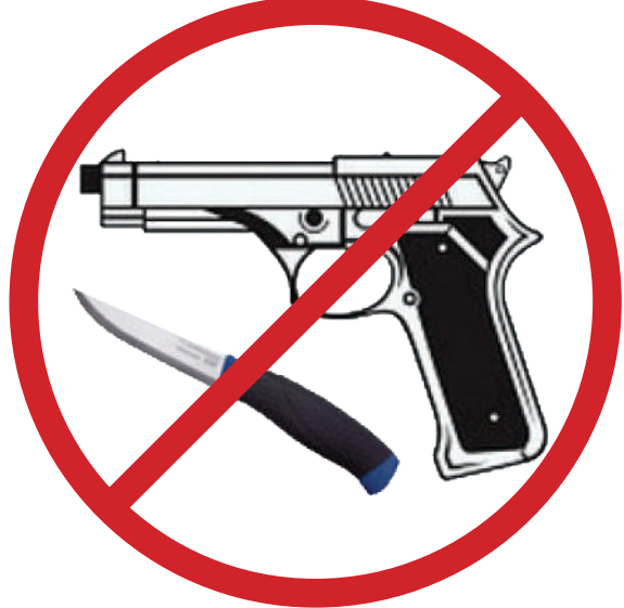
Her türlü kesici, delici alet ve ateşli silah