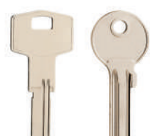
Anahtarlıksız basit anahtar