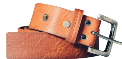
Basit tokalı kemer