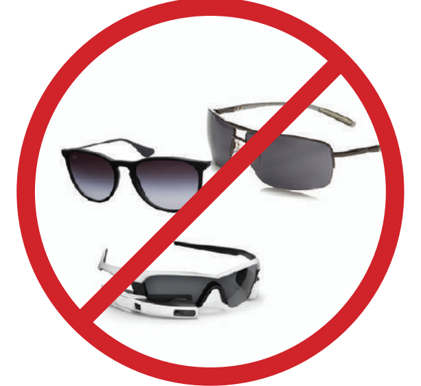
Her türlü plastik ve güneş gözlüğü dahil cam eşya