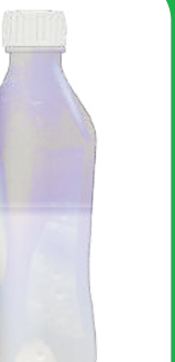
Şeffaf pet şişe içerisinde su

26/09/2012 tarihli ve 28423 sayılı Resmi Gazetede yayımlanan "Adayların ve Sınav Görevlilerinin Sınav Binalarına Giriş Koşullarına İlişkin Yönetmelik" gereği, sınav gizliliği ve güvenliği kapsamında sınav binalarında hiç bir eşya emanete alınmayacağından; adayların / görevlilerin sınav binalarına;