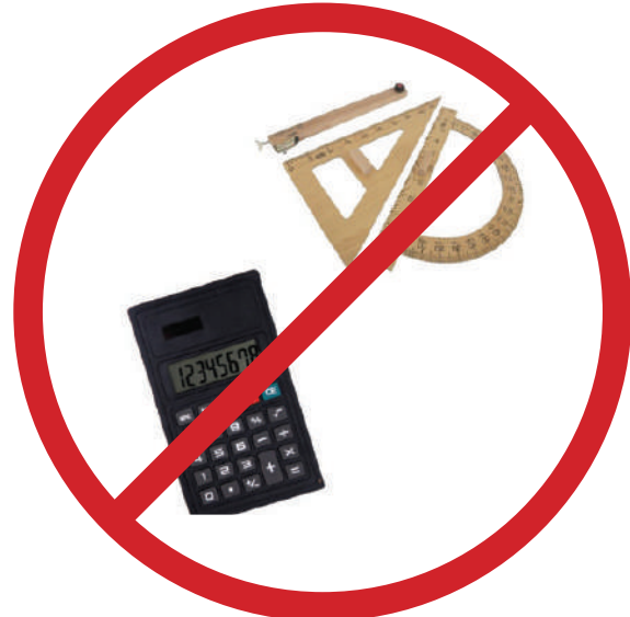
Hesap cetveli, hesap makinesi