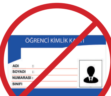
Öğrenci Kimlik Kartı