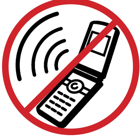
Cep telefonu, çağrı cihazı, telsiz