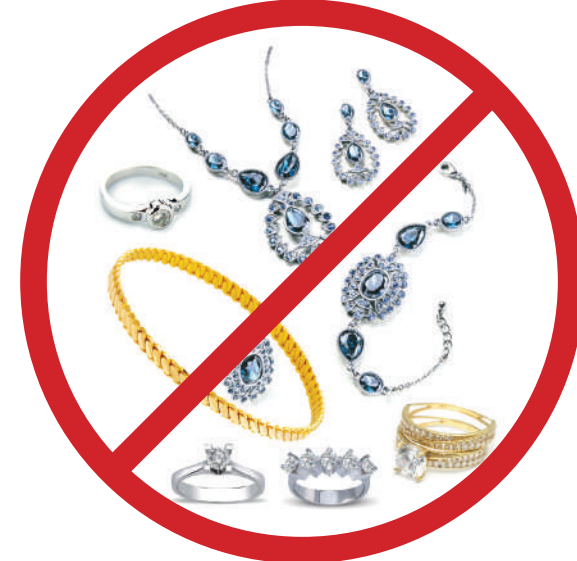
Bilezik, kulaklık, küpe, her türlü taşlı yüzük, broş vb. takı