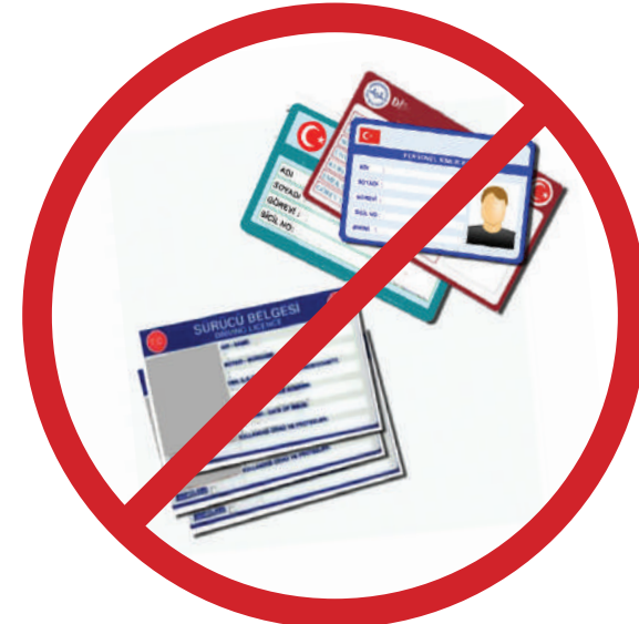
Ehliyet ve kurum kimlik kartları