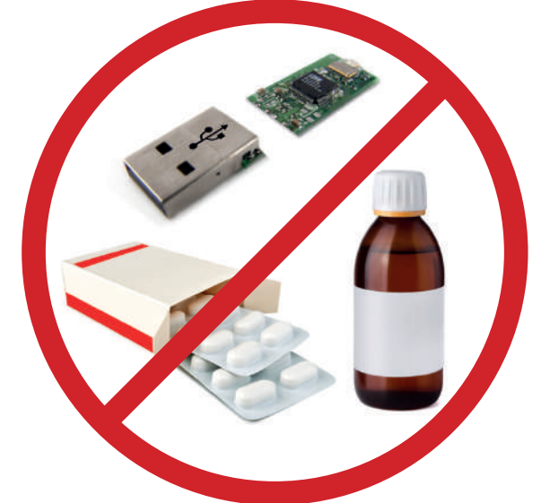
ÖSYM'den resmi izin alınmamış ilaç ve her türlü cihazlar