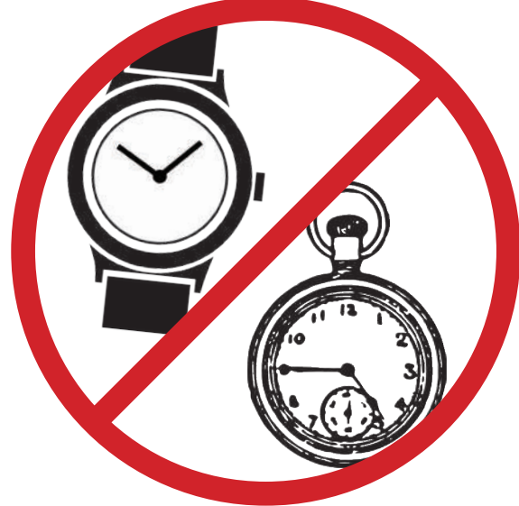
Her türlü saat ve sözlük işlevi olan aygıtlar