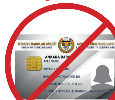
Avukat Kimlik Belgesi