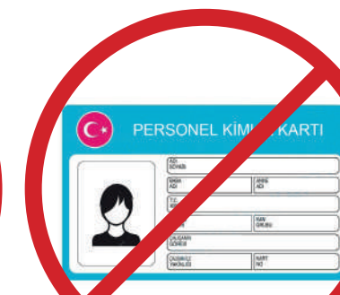
Personel Kimlik Kartı